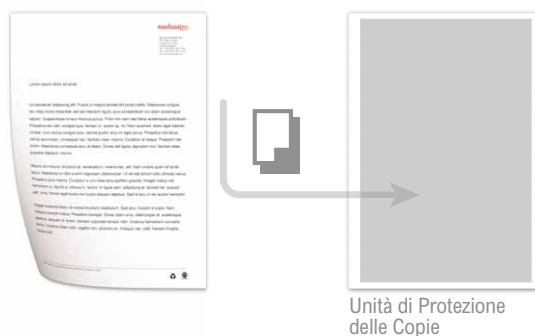
Unità di Protezione delle Copie